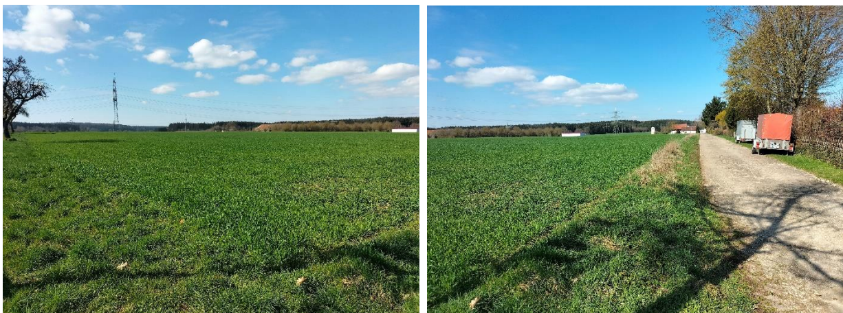
Abb.: Ansichten Richtung Süd und West