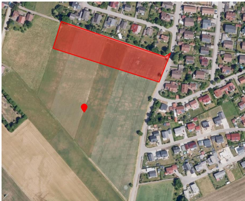
Abb.: Brutvorkommen Feldlerche