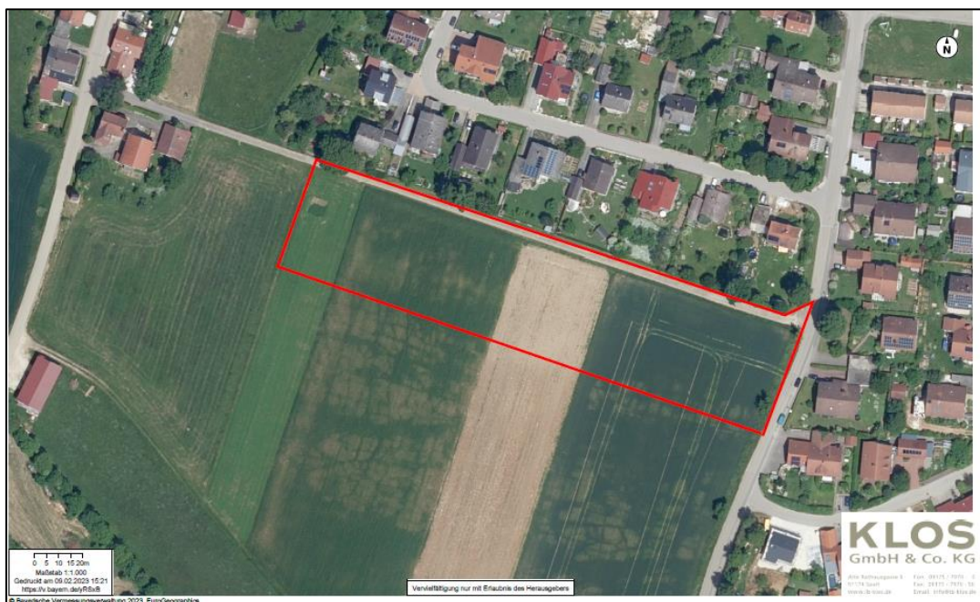
Abb.: Übersicht des Baugebietes (IB Klos 2023)

Die Maßnahme liegt im Naturpark "Altmühltal". Kartierte Biotope sind auf der Fläche und im näheren Umkreis nicht vorhanden. Einträge in der Artenschutzkartierung sind ebenfalls in weitem Umkreis nicht vorhanden.